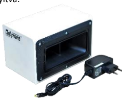
Hálózati adapter és rágcsálóriasztó

Az optimális elhelyezés az adott nyílással (ahonnan be tudnak jönni a kártevők) ellentétesen (szemben) található helyen van. Pl. ajtóval szemben levő falsík mentén, ajtó felé irányítva.