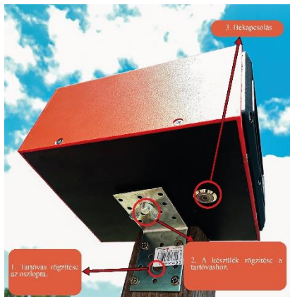
Rögzítés és bekapcsolás